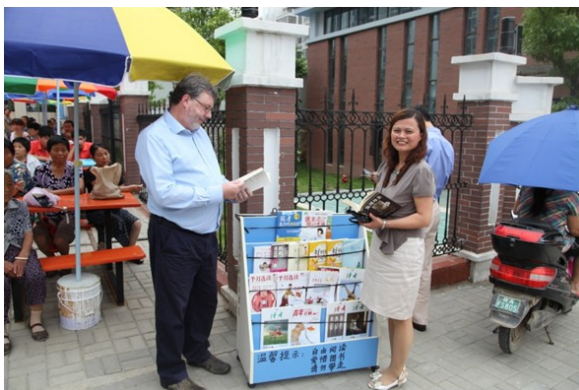
锦城小学为家长开设了阅览区