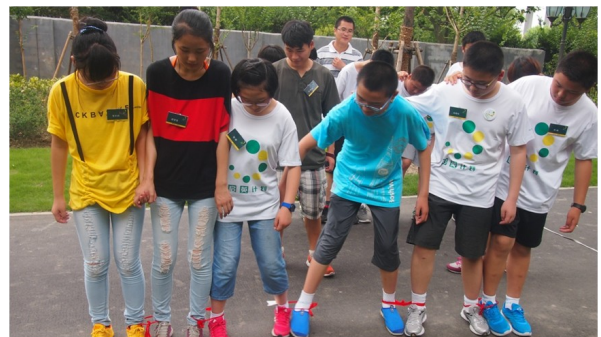
团队游戏，让学生以团队的形式去面对问题，理解和尊重同伴的感受，共同寻求解决的办法。