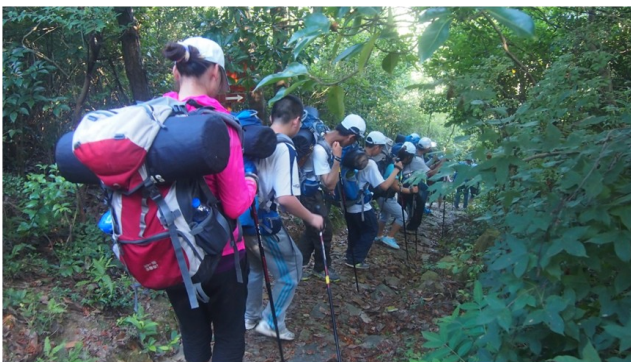
崎岖而陡峭的山路好比成长的过程，学习为自己负责，不断迎接挑战，发现自己的能力。