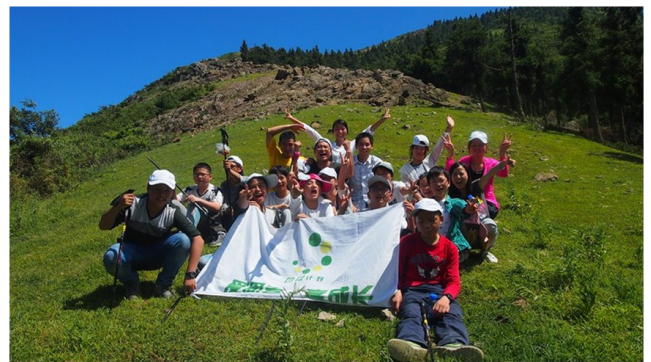
崎岖而陡峭的山路好比成长的过程，学习为自己负责，不断迎接挑战，发现自己的能力。