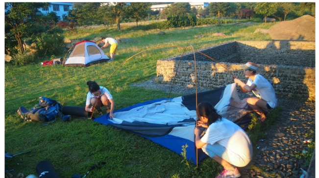
野营生活，一切都得靠自己。衣食住行，每一样都需要自己动手去完成。每天到达目的地后一个非常重要的事情就是搭建好帐篷，然后开始烹饪食物，这是最放松和开心的时刻。