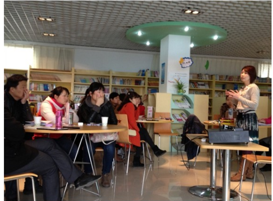
图书馆老师的小说类阅读计划

理由、体裁、书名、阅读方式以及应用。」透过分析发现：在小说的体裁方面，以科普小说的阅读计划最多，其次是历史小说、冒险小说和章回小说；在阅读方式和阅读应用方面，包括了：结合生活经验、融入课程主题、运用合共读书、老师导读、学生自行阅读、欣赏相关视频、设计阅读答卷、合作创编、撰写读后心得以及实物观察，阅读计划内容如下表。