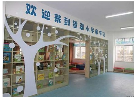
望湖小学拥有联盟内最大的图书馆

会议期间，教育局官员、基金会嘉宾还参观了联盟内2发起校望湖小学、卫岗小学和2所拉手校葛大店小学、锦城小学，实地感受了联盟学校浓郁的阅读校园文化氛围。