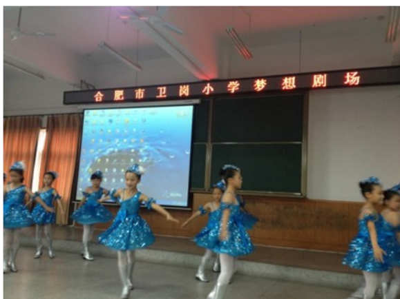
卫岗小学梦想剧场：绘本剧舞蹈《大脚丫跳芭蕾》