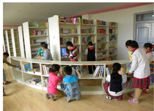
葛大店小学图书馆非常受学生喜爱