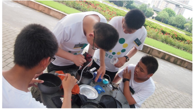
户外知识技能的学习不仅动手，还要动脑，学习如何更好的安排4天的野营生活。

其实孩子们都是可以的，当他到一个陌生的环境中，在没有家长、老师的‘无私帮助’后，他们给我们展现的完全是另外一个他，这也是我们家长和老师特别渴望出现的这个‘他’。”