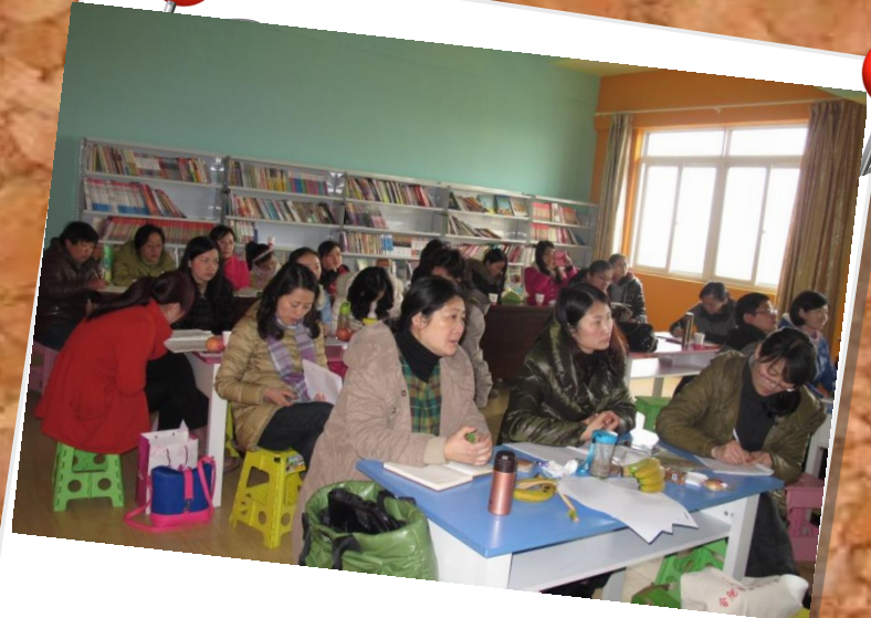
最后一期在金葡萄小学的培训中