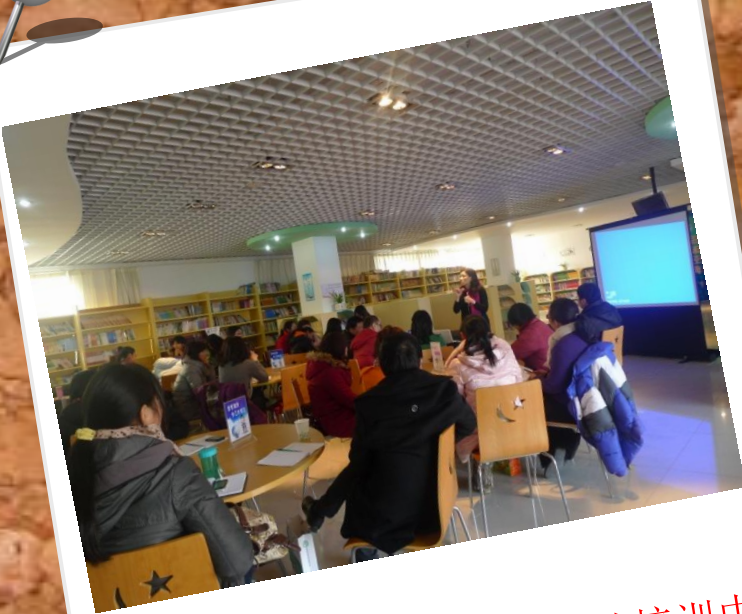
第一期培训在青年路小学的培训中