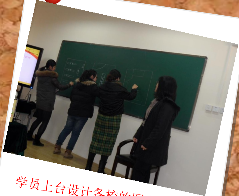
学员上台设计各校的图书馆布局图